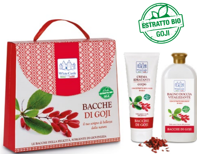
h = 225 mm