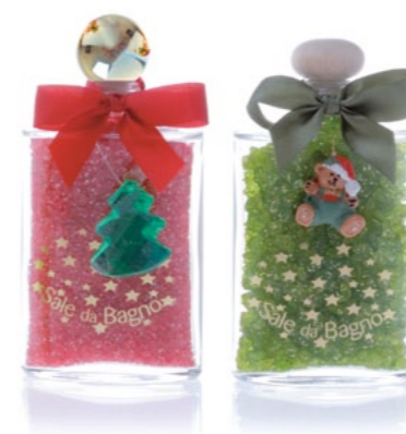
h = 130 mm