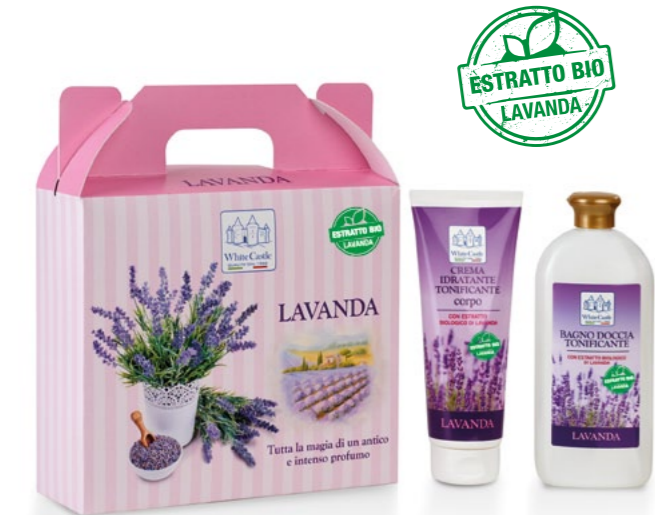
h = 260 mm