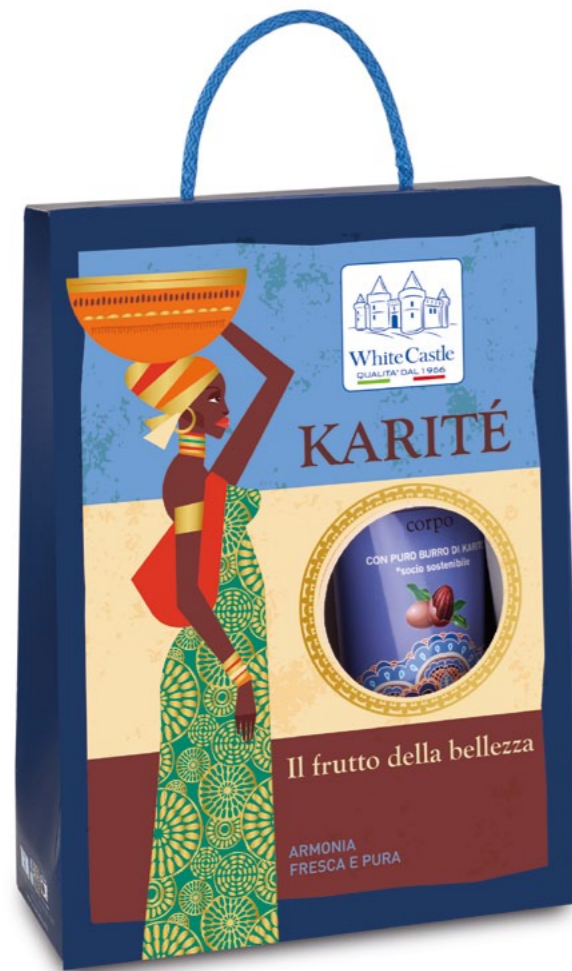
h = 265 mm