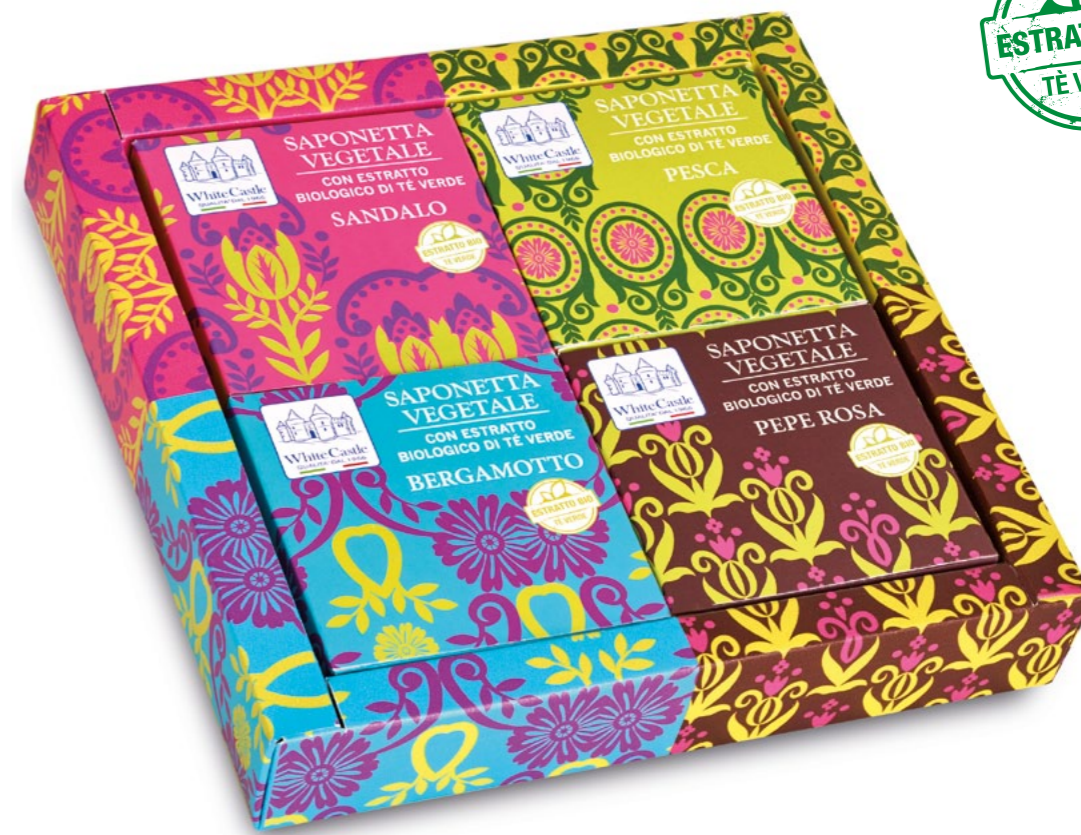
h = 195 mm