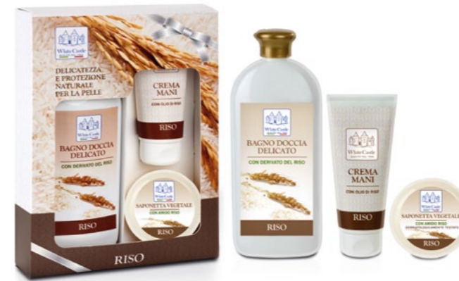
h = 240 mm

- Vegetable soap with rice starch, dalle proprietà lenitive e rinfrescanti.