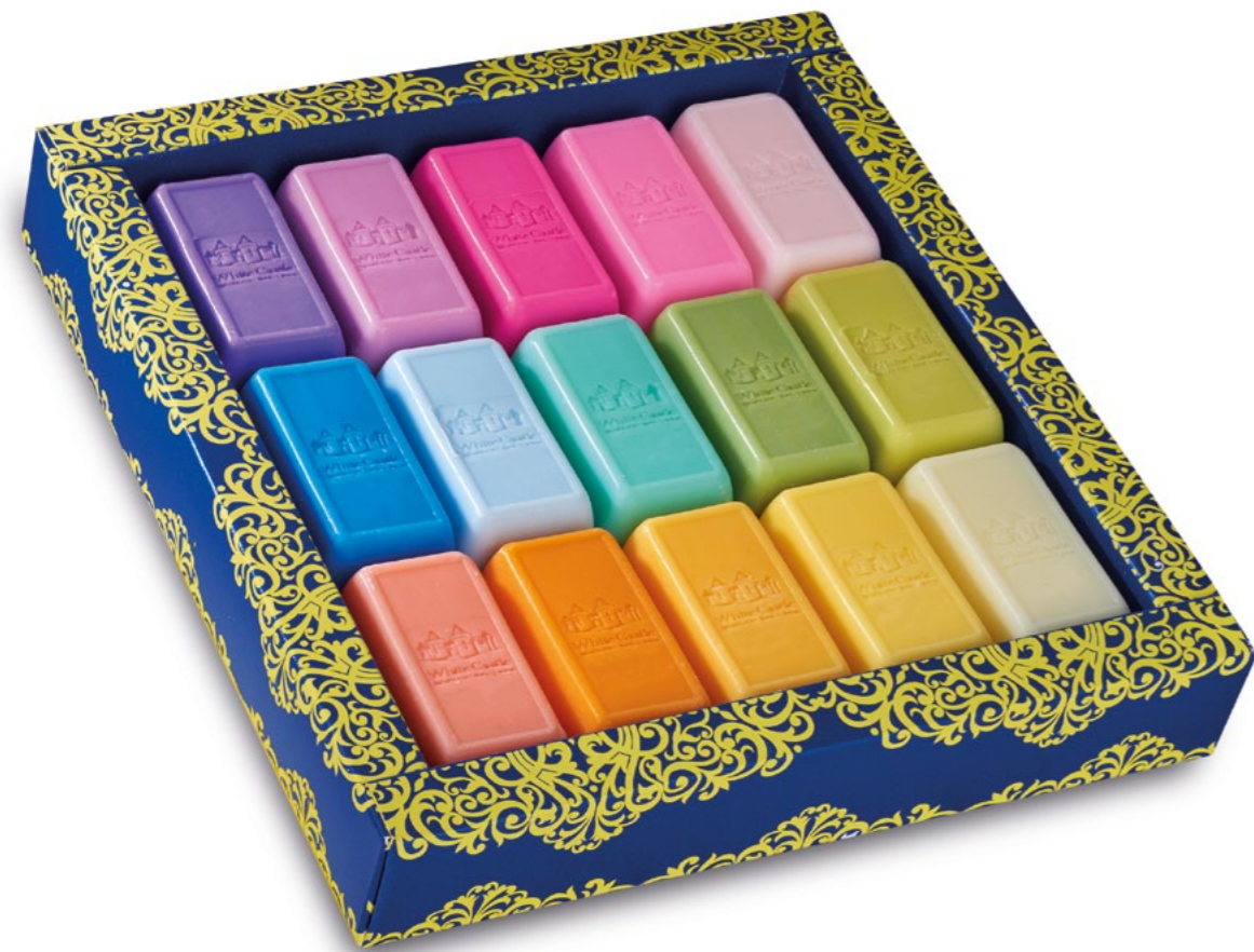
h = 210 mm