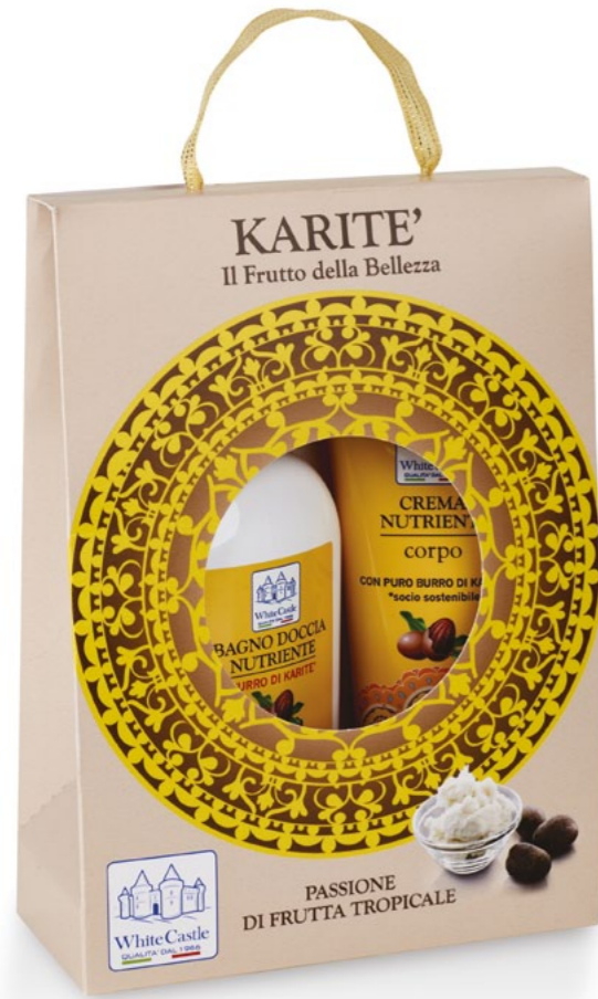
h = 265 mm