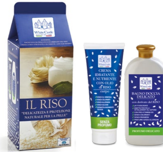
h = 295 mm