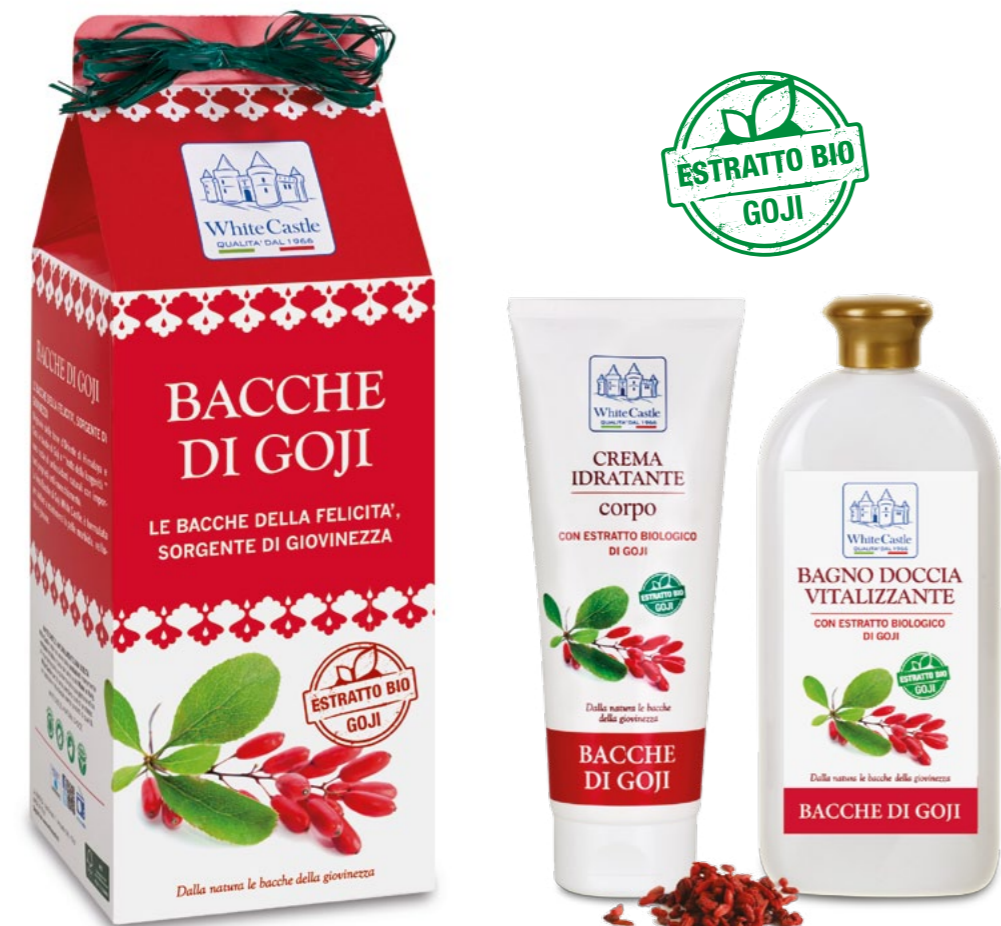
h = 295 mm