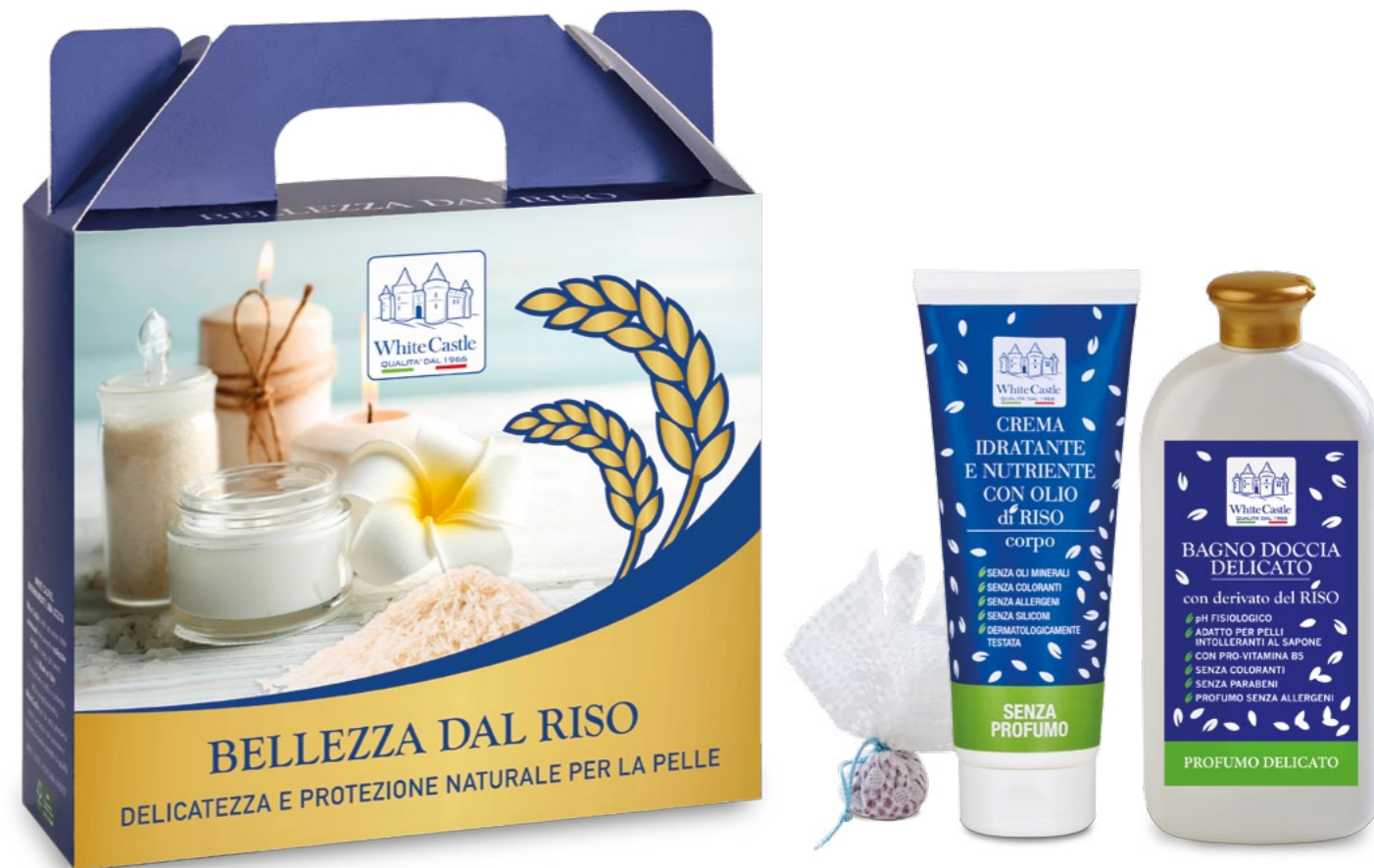
h = 260 mm