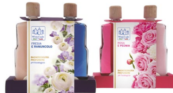
h = 198mm