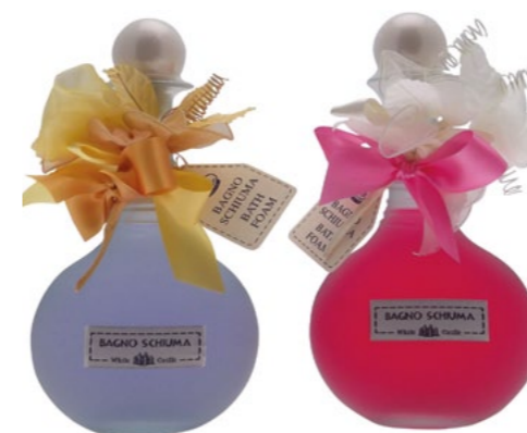
h = 230 mm